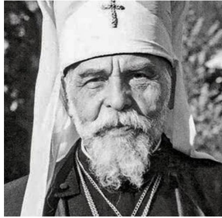
Патріарх Йосиф Сліпий